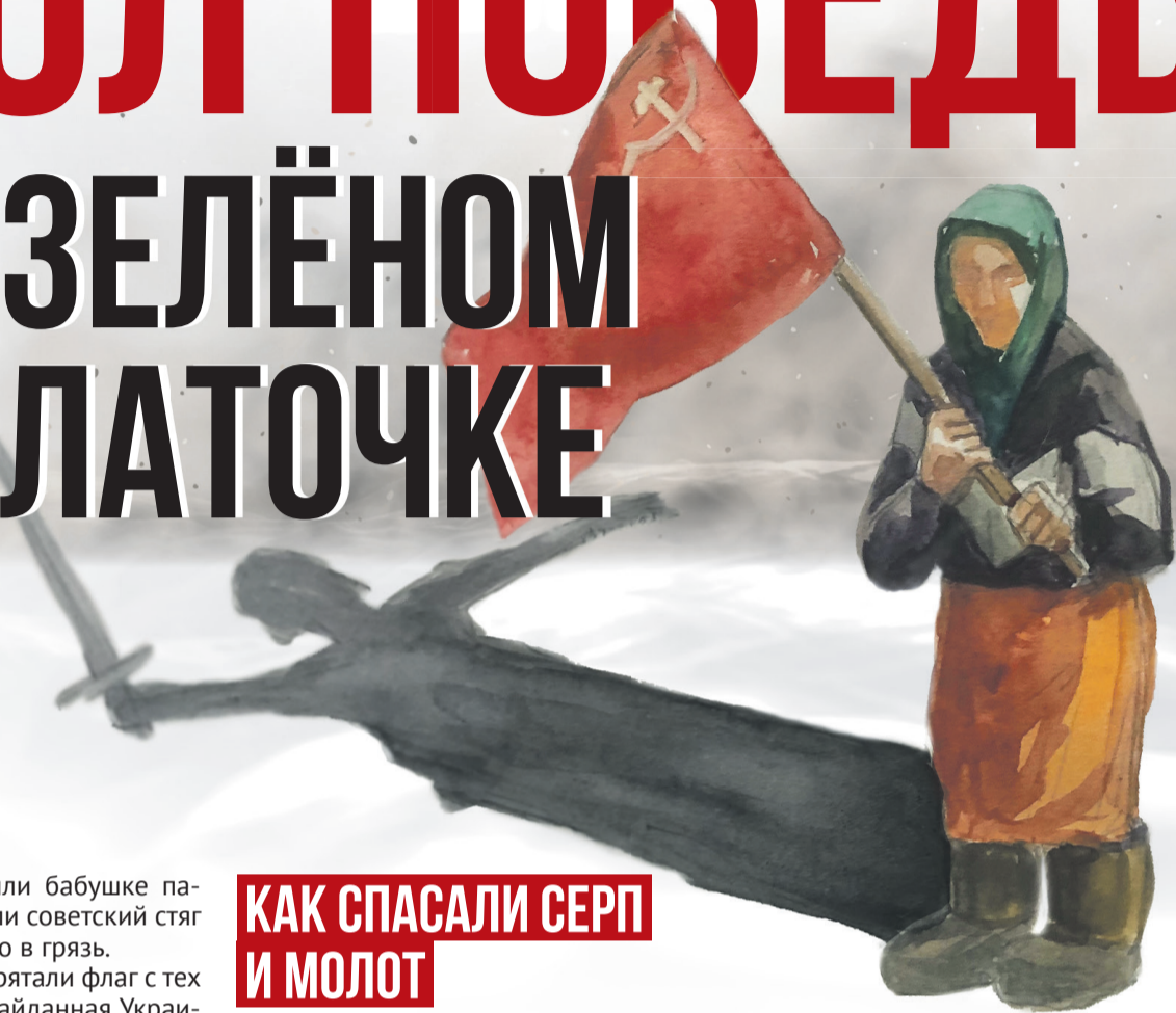
Рисунок Елены Рябоваловой, коллаж Алексей Беленёв