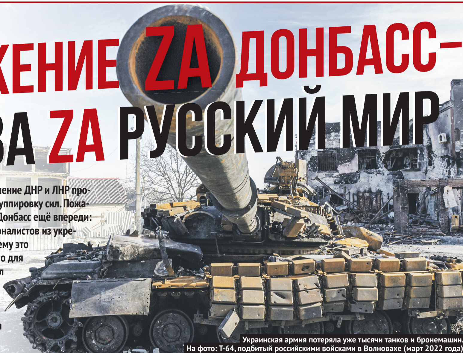
Украинская армия потеряла уже тысячи танков и бронемашин. На фото: Т-64, подбитый российскими войсками в Волновухе (март 2022 года)